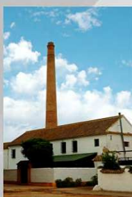
CORTIJO DEL CANAL Antequera